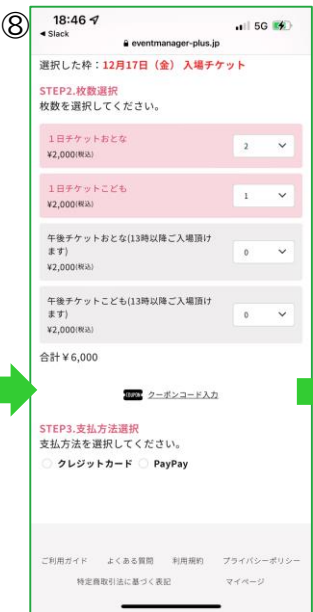
【チケット選択ページ】 日程選択後、ご希望の チケット券種(枚数)を選択 ※クーポンコードを使用しない方のチケット 購入があれば、ここでまとめて入力