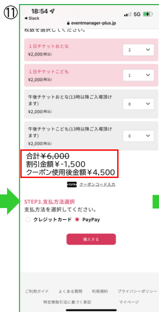
【チケット選択ページ】 赤枠内にクーポン適用後の 合計金額が反映されます ※クーポンコードを使用しないチケットが ある場合はそれを含んだ料金が 表示されます