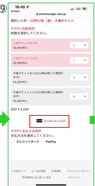
【チケット選択ページ】 次に赤枠内の「クーポンコード入力」を タップ