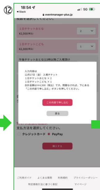
【チケット選択ページ】 最後に購入内容を確認して 「この内容で申し込む」をタップ