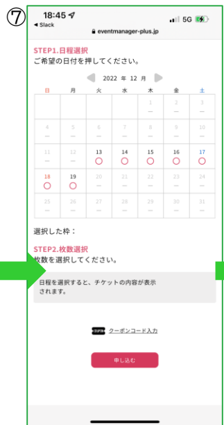
【チケット選択ページ】 カレンダーにて来場希望日を選択