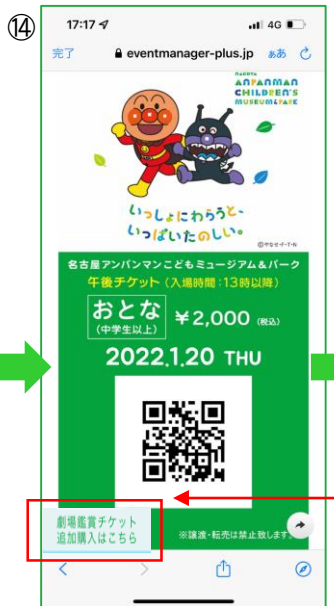
【電子チケット】 複数枚を購入している場合はスワイプにて 表示が可能

「やなせたかし劇場」の鑑賞チケットは、 来場希望日に空席(事前に③で確認)がある場合に購入することができます 鑑賞チケット500円(1歳以上1人につき)が別途必要です 赤枠ボタンからお買い求めください 補助の対象とはなりませんので、ご了承ください