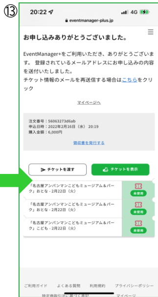
【購入完了ページ】 このページからチケットの表示が可能 ※領収書の発行が可能